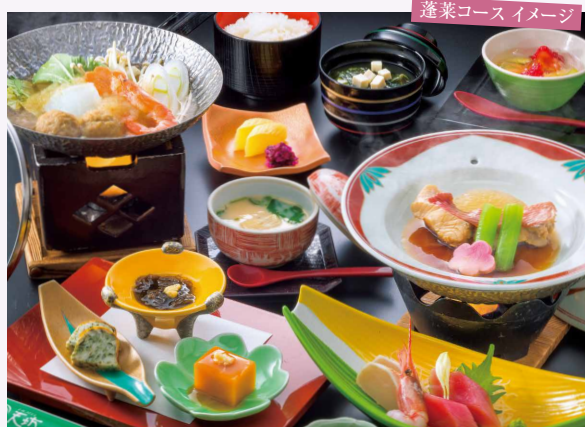
蓬菜コースイメージ

お一人様 10,450円 (消費税込) (消費税別9,500円)+別途入湯税100円