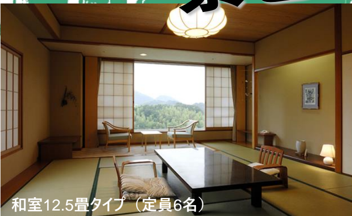
和室12.5畳タイプ (定員6名)