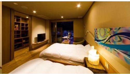
露天風呂付客室 (定員2～5名)