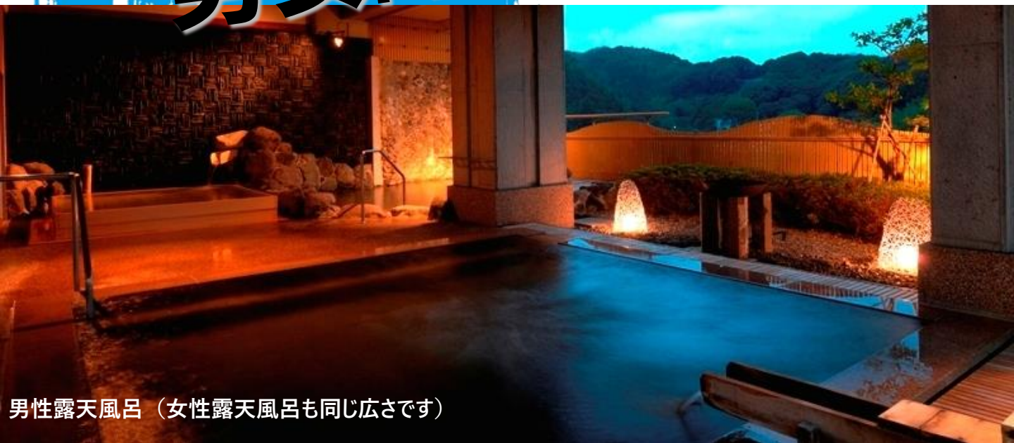
男性露天風呂（女性露天風呂も同じ広さです）