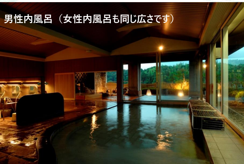
男性内風呂（女性内風呂も同じ広さです）

大浴場前にバスタオル置き場を新たに設置しました。入浴の度に新しいバスタオルがご利用いただけます。