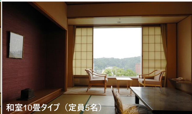
和室10畳タイプ (定員5名)

伊豆長岡ホテル天坊の客室づくりはユニバーサルデザイン。そして何より景色優先の窓サイズ。 伊豆長岡ホテル天坊の客室づくりは、段差を少くし、スイッチを大きくするなど、当初から人に優しい客室づくりをしています。 同時に、高台に位置する立地を活かした、景色を取り込むような大きな窓が売物となっています。 長岡の街並みから源氏山、天城連山、霊峰富士と客室タイプでいろいろな景色がご覧いただけます。 お客様からのご希望の多い禁煙室を平成29年6月に5室改装いたしました。