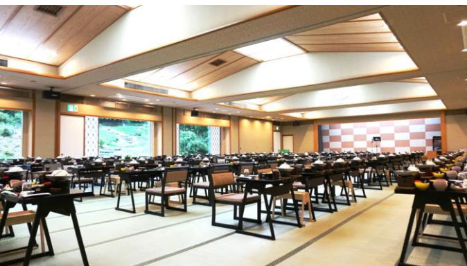
足楽膳（畳に椅子・テーブル 100名様まで）

最大180名、8名まで ご利用いただける多彩な 宴会場をご用意 最大宴会場は「天城」の235 畳、この他に「葛城」96畳もご ざいます。各宴会場とも、遮音性 の高いパーティションで仕切れ、 全8区画まで、お客様の用途に 合わせてご用意いたします。 女性、ご年配のお客様に好評の 足楽膳も180名様分ご用意がご ざいます。