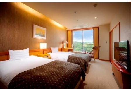
最上階12.5畳+ツイン (定員8名)