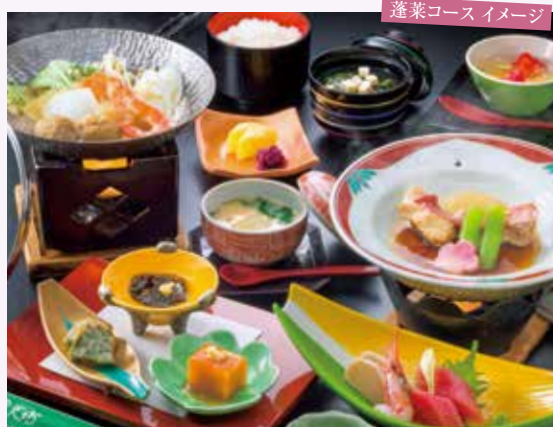
蓬菜コースイメージ

※お料理・室料・入浴料を含んでおります。 ※タオルは別途料金でご利用いたします。 ※季節・ご人数により料理内容・食器が変わる場合がございます。