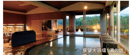
展望大浴場「湯の坊」