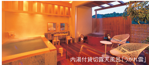
内湯付貸切露天風呂「うかれ雲」