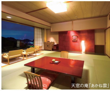
天窓の庵「あかね雲」