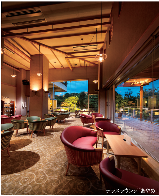
テラスラウンジ「あやめ」