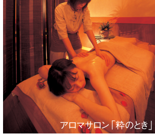
アロマサロン「秋のとき」