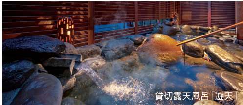
貸切露天風呂「遊天」