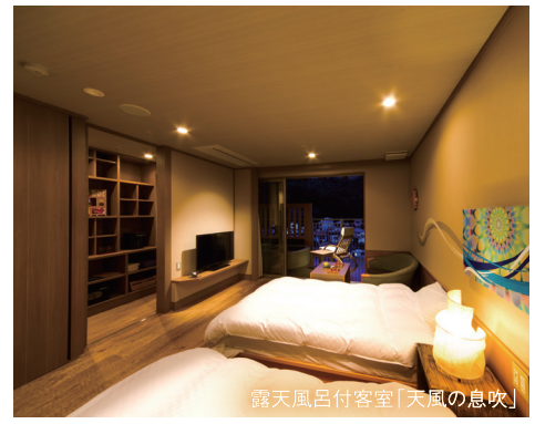
露天風呂付客室「天風の息吹」